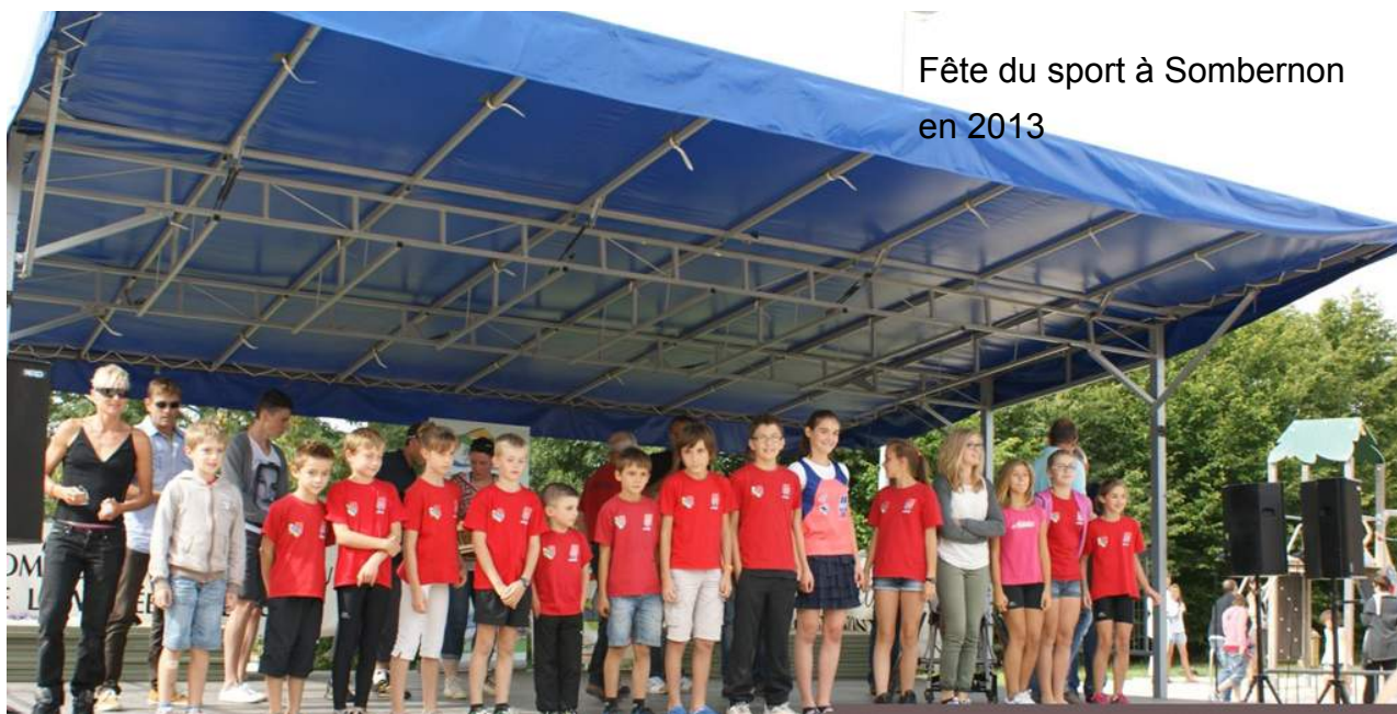
Fête du sport à Sombernon en 2013