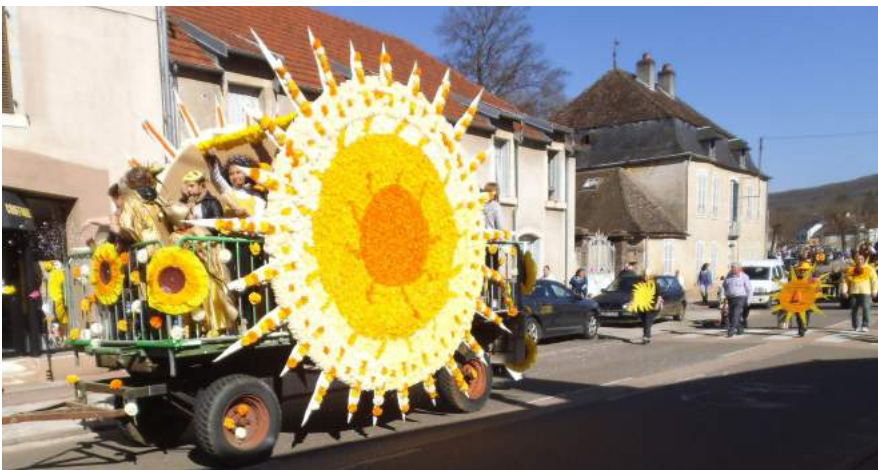
Le char « Soleil de Sombernon » en 2014