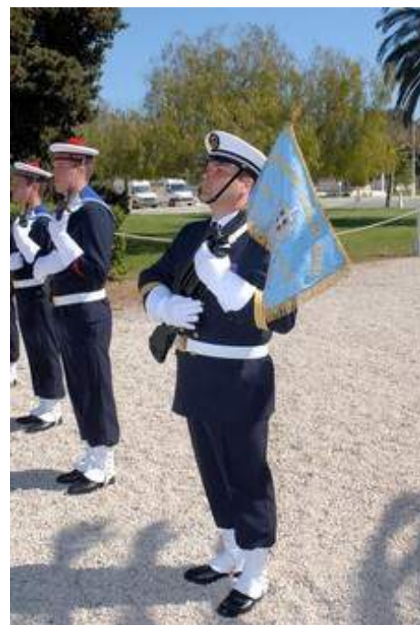
Remise de fanion PMM à Hyères