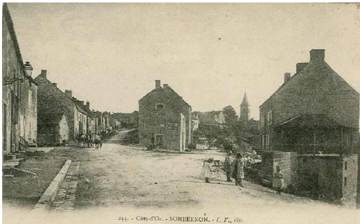
Le rond-point de l'abreuvoir