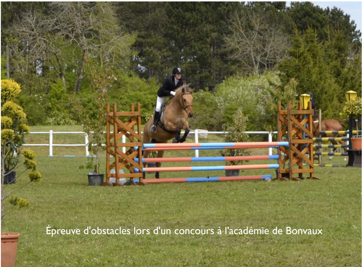
Épreuve d'obstacles lors d'un concours à l'académie de Bonvaux

Je dirais qu'il faut aller dans le sens de ses rêves et de ne pas se mettre de barrière. On est souvent capable de plus de choses que l'on ne croit.