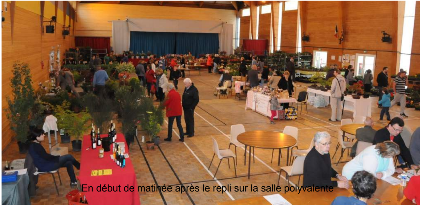
En début de matinée après le repli sur la salle polyvalente

Le 1 er dimanche de mai, la météo ne permettant pas un déroulement agréable au Parc Spuller, la foire aux plantes s'est déplacée à la salle polyvalente.