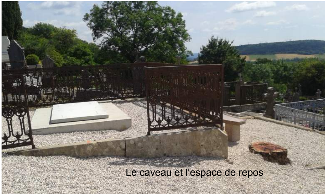
Le caveau et l'espace de repos

En 2016, il est prévu de terminer la restructuration de cette partie, la plus ancienne du cimetière