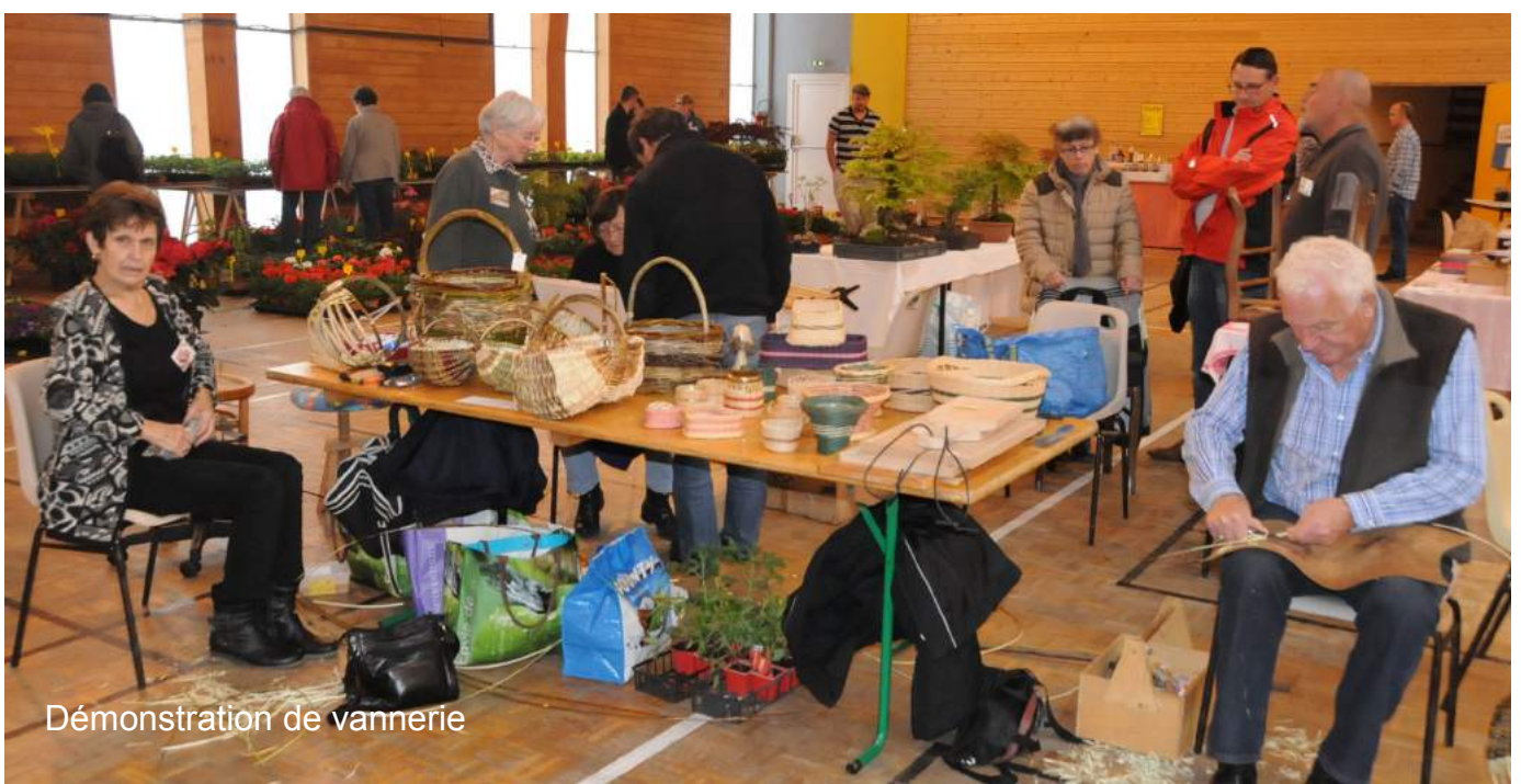
Démonstration de vannerie

Rendez vous en 2016, le dimanche 1 er mai au Parc Spuller ou à la salle polyvalente si les éléments climatiques ne sont pas favorables.