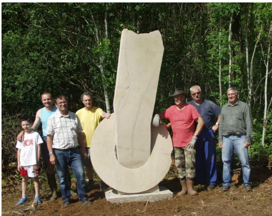
Les bénévoles posent devant la sculpture.

La pose a été réalisée par les bénévoles de l'association EVA, qu'ils en soient ici remerciés.