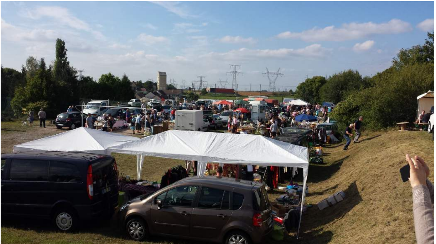
Une vue du vide-grenier 2014

Participez nombreux à ces événements qui font le bien-vivre ensemble dans notre village.