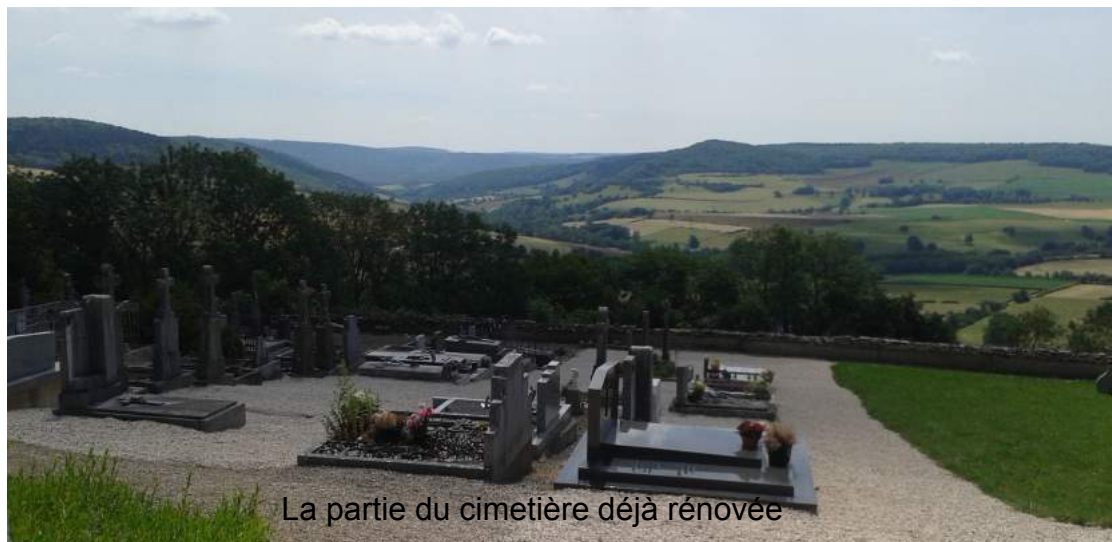
La partie du cimetière déjà rénovée